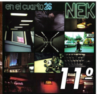
"Noche de Febrero" 11º