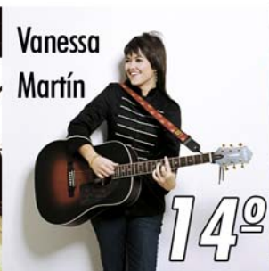
"Durmiendo Sola" 14º