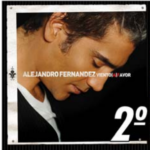
"Te Voy a Perder" 2º

A CONTINUACIÓN DETALLAMOS EL ÓRDEN FINAL DE LOS TEMAS CANDIDATOS. DAMOS LAS GRACIAS A LAS MÁS DE 500 PERSONAS QUE HAN PARTICIPADO CON SU VOTO Y A LAS DISCOGRÁFICAS Y REPRESENTANTES POR SU APOYO.