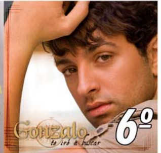
"Te Iré a Buscar" 6º