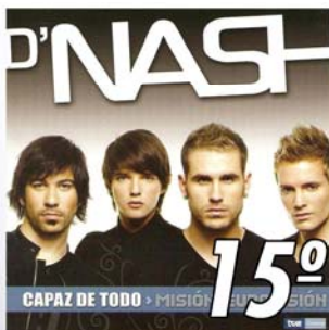
"¿Dónde Estás?" 15º