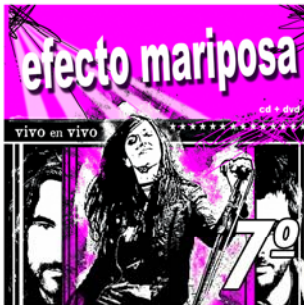
"Si Tú Quisieras" 7º