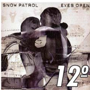
"Chasing Cars" 12º