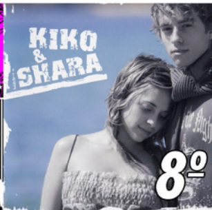
"Mi Razón de Ser" 8º