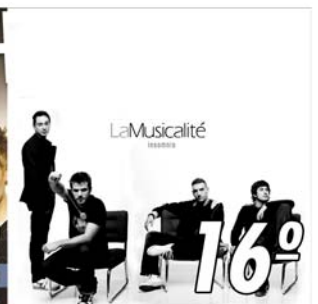
"La Musicalité" 16º