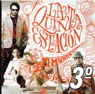
"Sueños Rotos" 3º